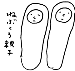
drawing by Junko Sato

*つれづれ団とは 2008年4月に結成された東北の日常生活を「遊び」でおもしろくするために活動している人々のゆる〜い集まりです。 http://tsurezuredan.cocolog-nifty.com/