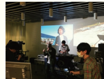
うぶこえストリーム vol.FINAL / Ubukoe Stream vol. FINAL 2012年3月6日 / March 6, 2012 せんだいメディアテーク / sendai mediatheque うぶこえプロジェクト / Ubukoe Project