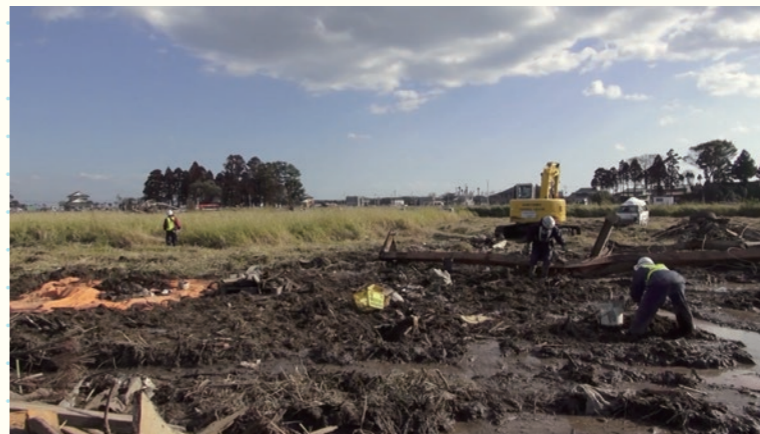
仙台のがれき撤去 / Removing Debris in Sendai 2011年5月—2012年4月 / May 2011 to April 2012 宮城県仙台市宮城野区 / Miyagino-ku, Sendai, Miyagi 高野裕之 / Hiroyuki Takano

It lets us see many more scenes that ordinary people do not have access to, such as workers sorting out gravestones that were knocked over by the tsunami one by one, picking up albums and other items by hand, and debris processing plant where debris were separated into more than 10 categories, according to their materials.