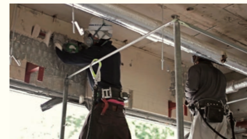
南三陸の解体 / Dismantling in Minamisanriku 2012年9月—2013年1月 / September 2012 to January 2013 宮城県南三陸町 / Minamisanriku Town, Miyagi 高野裕之 / Hiroyuki Takano