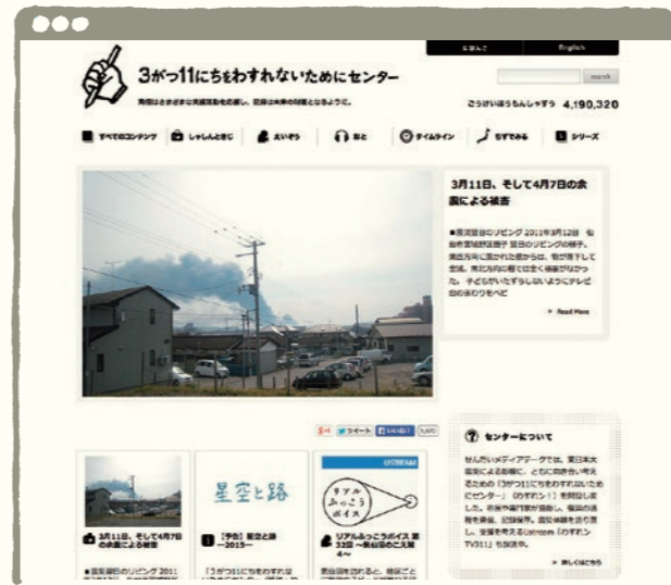
わすれん!ウェブサイト http://recorder311.smt.jp

Since its launch of Japanese website on June 25, 2011, recorder311 has been publishing / updating articles, sorting out and contextualizing contributed photographs, moving images, sound recordings, and texts. With support from the Kingdom of Netherland, a part of the materials published on Japanese website was subtitled in English and the English website was released on July 1, 2012. Furthermore, in October 2014, recorder311 started meta-data linking with “Hinagiku” the Great East Japan Earthquake Archive” run by the National Diet Library. In this book, materials with WEB-JP symbol has been published on the Japanese website, while ones with WEB-EN symbol can be found on the English website.