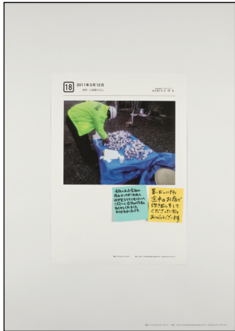
パネル番号：016_006 資料名： 18. 2011年3月12日 記録日： 2011年3月12日 撮影：三浦廣行 地域情報：仙台市