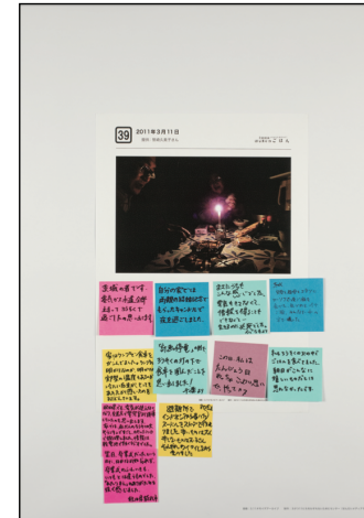
パネル番号：016_011 資料名： 39. 2011年3月11日 記録日： 2011年3月11日 地域情報：仙台市