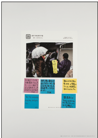
パネル番号：016_009 資料名： 35. 2011年3月17日 記録日： 2011年3月17日 地域情報：仙台市