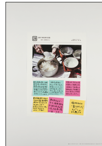
パネル番号：016_008 資料名： 28. 2011年3月12日 記録日： 2011年3月12日 地域情報：仙台市