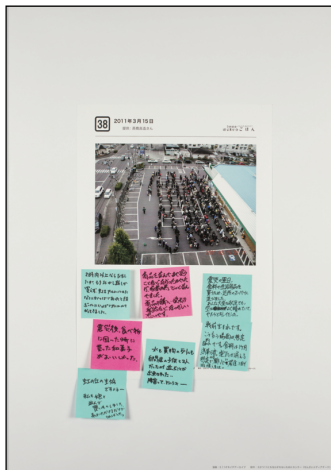
パネル番号：016_010 資料名： 38. 2011年3月15日 記録日： 2011年3月15日 地域情報：仙台市