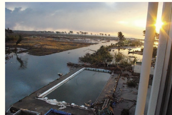
荒浜小学校校舎にて／At the building of Arahama Elementary School 2011年3月12日 6時24分／March 12, 2011 at 6:24 宮城県仙台市若林区／Wakabayashi-ku, Sendai, Miyagi 仙台市立荒浜小学校／Arahama Elementary School