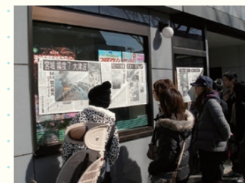
上杉の新聞販売店／A newspaper stand in Kamisugi 2011年3月12日 13時44分／March 12, 2011 at 13:44 宮城県仙台市青葉区／Aoba-ku, Sendai, Miyagi 三浦隆一／Ryuichi Miura