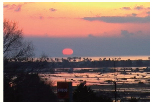
山元町役場から望む／View from the Yamamoto Town Hall 2011年3月12日 5時49分／March 12, 2011 at 5:49 宮城県山元町／Yamamoto Town, Miyagi 佐藤修一／Shuichi Sato

Around dawn, radio started to air the messages of encouragement for the listeners. It was when we saw the morning newspaper of March 12th that we first realized the scale of this disaster.